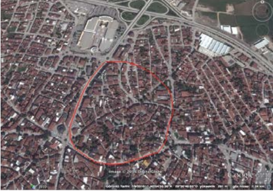
Resim 1. İlçe merkezinde Cuma Mahallesi