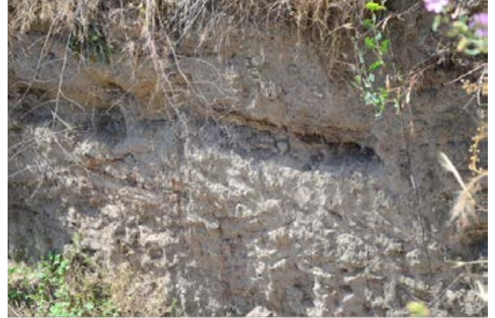
Resim 4. İnegöl Höyük'te yapılan kazı.