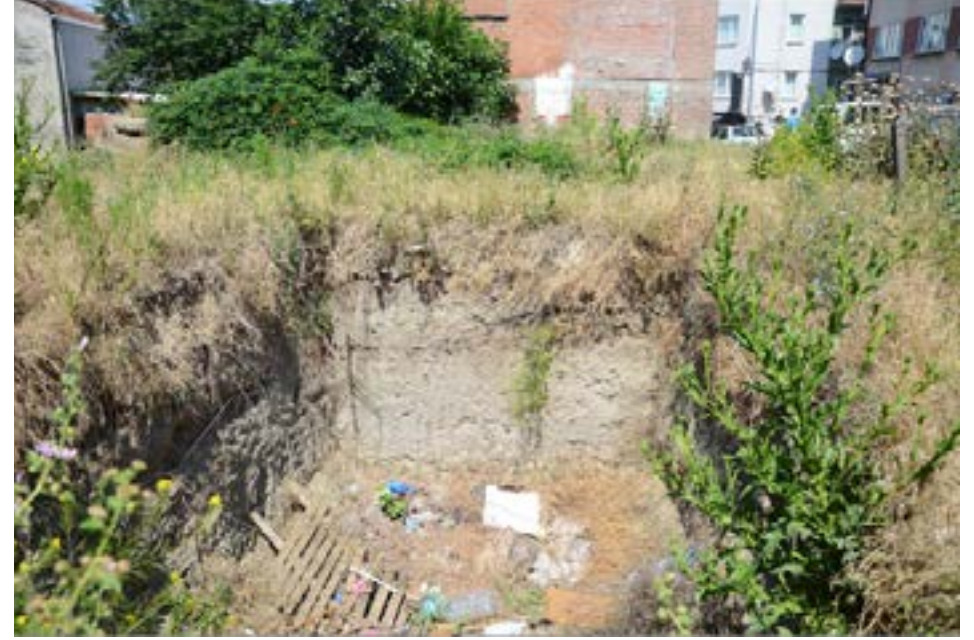
Resim 3. İnegöl Höyük'te yapılan kazı