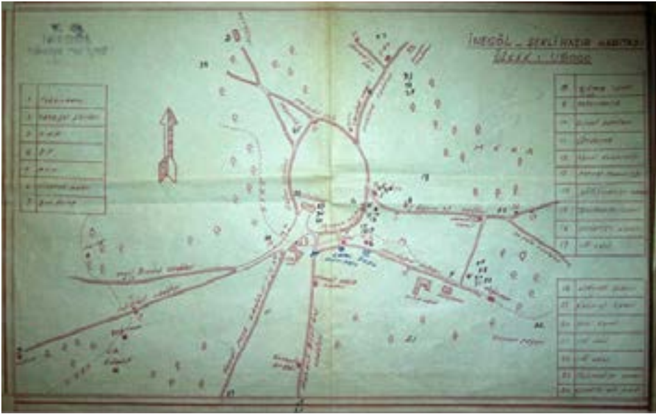
Resim 2. Halk arasında Yokuş mahallesi diye bilinen Cuma Mahallesi