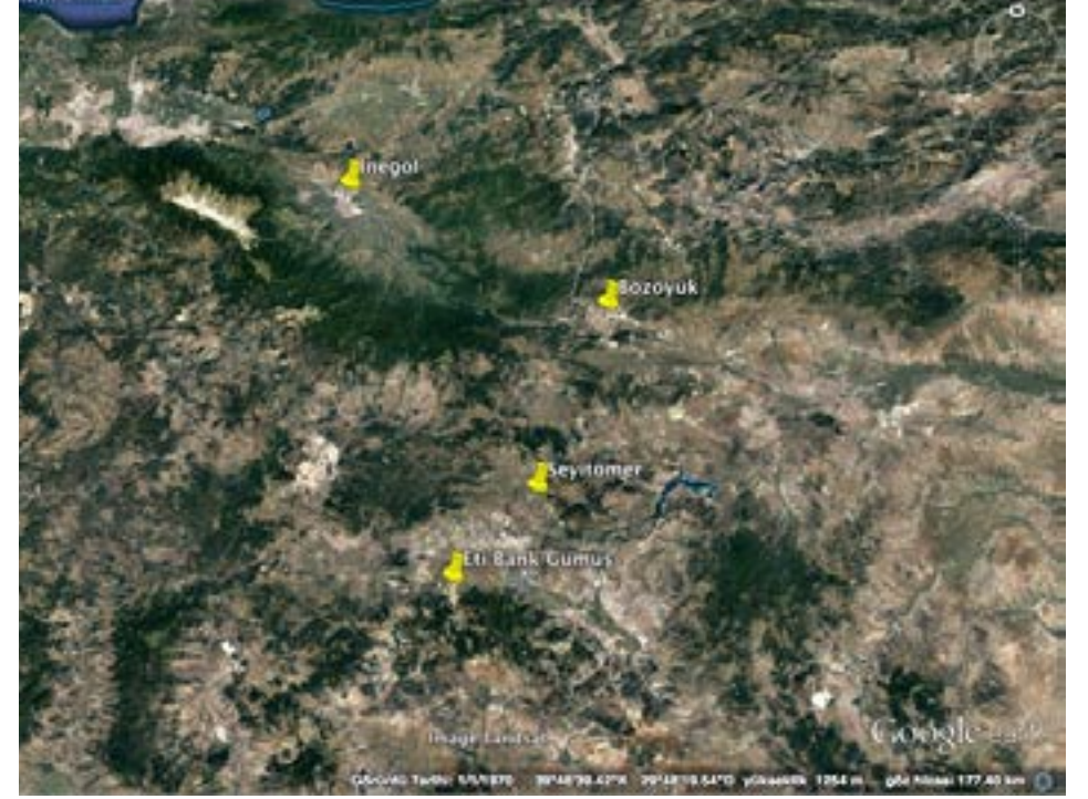
Resim 7. Kütahya'da gümüş maden yatakları.