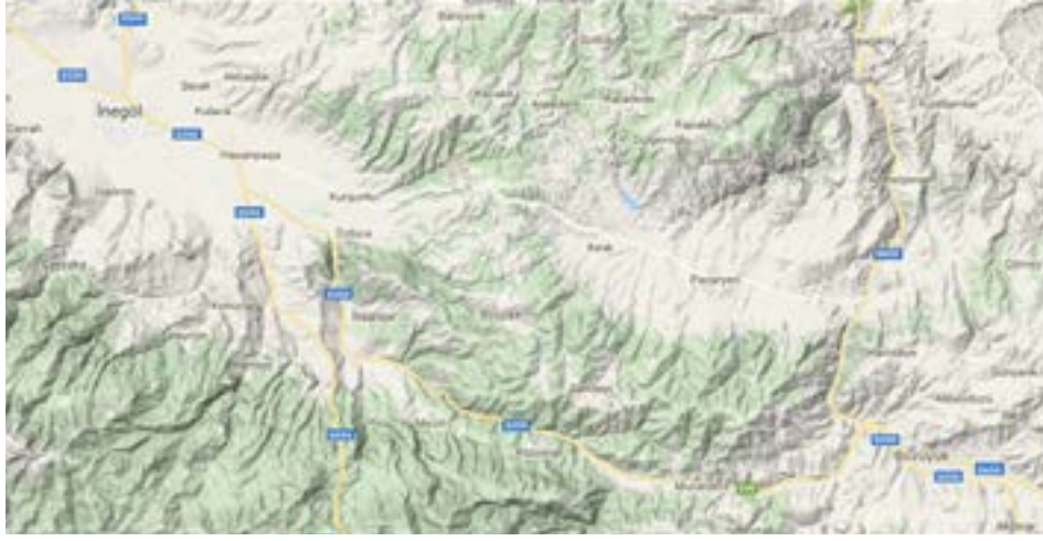
Resim 5. İnegöl ve çevresi.