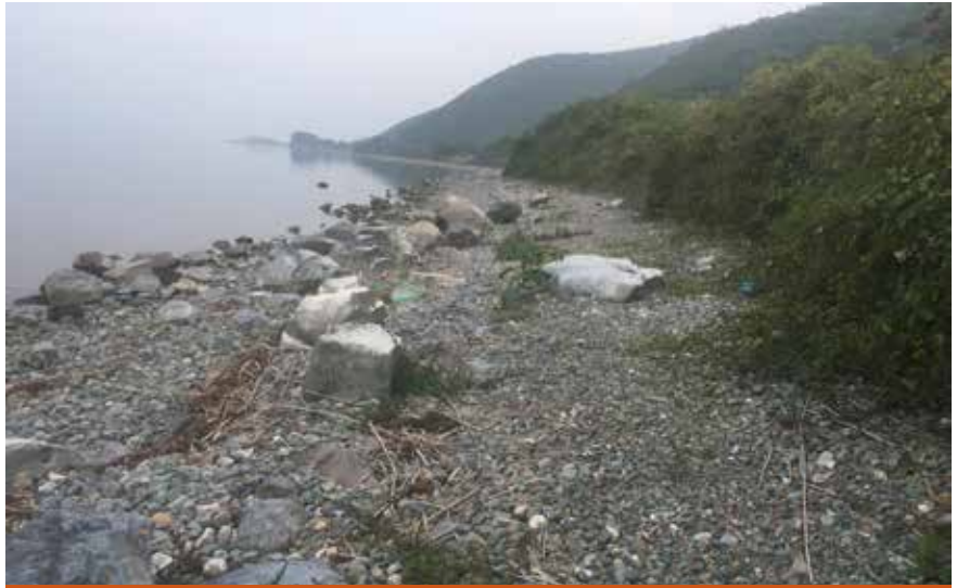
Resim 11: Kalıntıların bulunduğu alandan, doğuya doğru, Katzapos/Karacakaya Kayalığı'na bakış