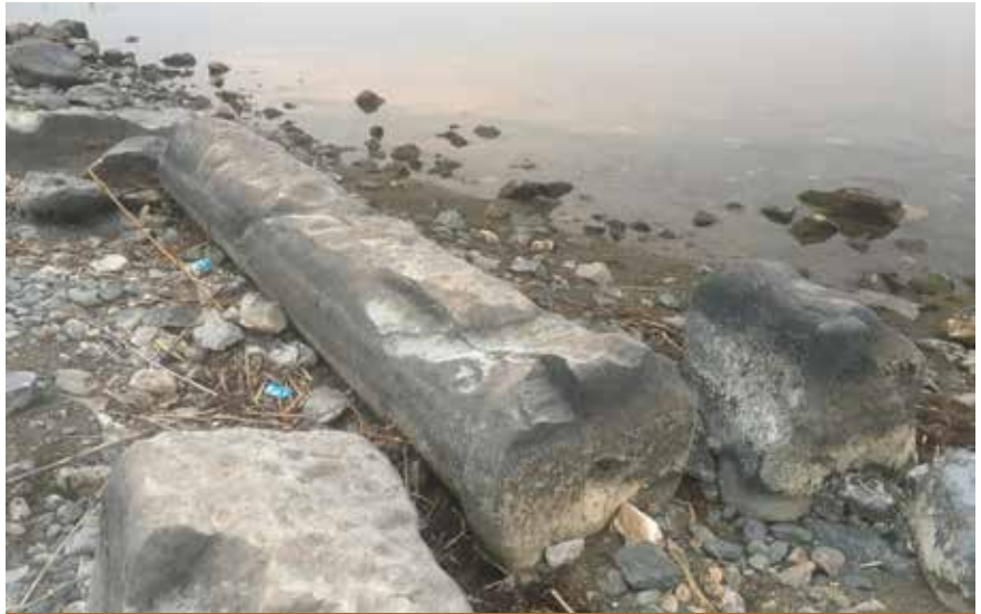
Resim 12: Kiliseye ait sütün gövdesi