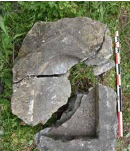
Resim 13: Parçalanmış Roma Dönemi'ne ait mezar steli