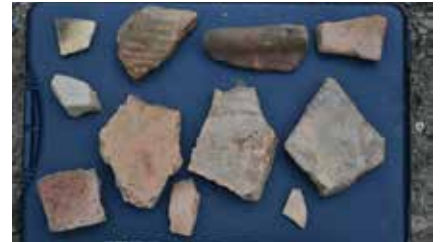
Resim 10: Zeytinlik yüzeyinde bol miktarda bulunan kaba kiremit kırıklarından örnekler