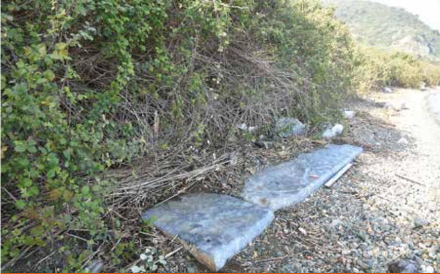
Resim 5: Mermer platform

Bu durumda akla gelen soru; kalınlıkların güneye doğru ne kadar ilerlediğidir? Bunu anlamak için kıyı ile karayı birbirinden ayıran çalılıkların arkasına geçtik (Resim 6). Gemlik-İznik kara yolu ile çalılığın arasındaki patika yol üzerinde gezinirken yapının güneye doğru ilerlediğini gösterir diğer bir işaret ile karşılaştık; köşeleri düz kesilmiş mermer bir blok (Resim 7). Mermer bloğun ön yüzünde yer alan profiller, bunun yine muhtemel yapıya ait mimari parçalardan birisi olduğunu açık bir şekilde ortaya koymaktadır. Ne şekilde açığa çıktığı belli olmayan mimari eleman, fark edilmesin diye üzeri ağaç dalları ile örtülü şekilde yolun kenarında duruyordu