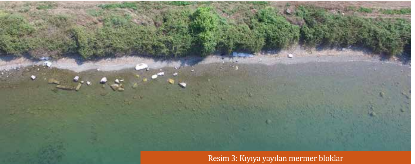
Resim 3: Kıyıya yayılan mermer bloklar