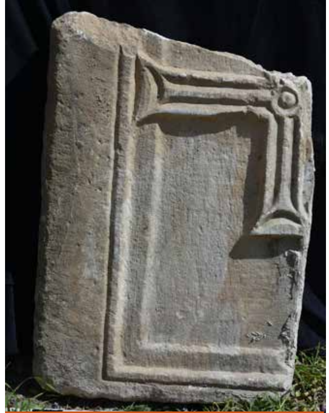
Resim 15: Kiliseye ait olduğunu düşündüğümüz haç motifli mermer korkuluk levhası

D.H. Farmer, The Oxford Dictionary of Saints (Oxford 2003).