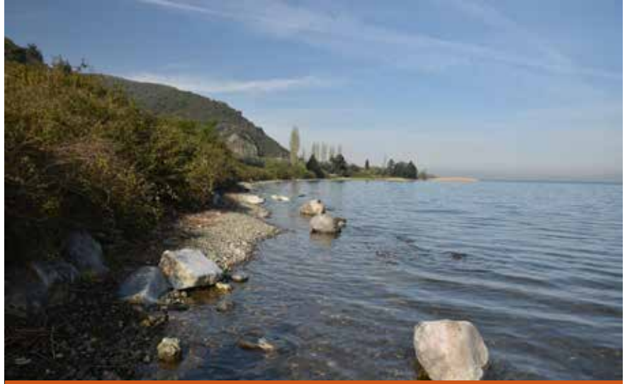
Resim 1: Sular çekilmeden önce

Göl kıyısında, bir bölümü su içinde, bir bölümü de yüzeyde dağınık bir şekilde tespit ettiğimiz kalıntı, çok sayıda mermer bloktan oluşmaktadır (Resim 3). Taş eserler arasında; yaklaşık tam korunmuş sütun gövdesi, profilli üst yapı elemanı, üzerinde dübel veya kenet delikleri korunmuş köşeli mermer bloklar özellikle dikkat çekmektedir (Resim 4). Kıyı şeridinde doğu-batı istikametinde uzanan, çalılıkların altında kaldığı için tam görünür hâle getiremediğimiz mermer bloklar ise, buluntu grubunu daha da önemli hâle getirmektedir (GPS: 40.385365, 29.636219). Konumları ve birbirleri ile ilişkileri nedeniyle aslı yerinde (in situ) korundukları anlaşılan beyaz damarlı gri mermerden iki blok, burada platform benzeri bir kalıntı ile karşı karşıya olduğumuz anlamına gelmektedir (Resim 5). Platformun toplam uzunluğu 381 cm, genişliği 100 cm, yaklaşık yüksekliği ise 12 cm olarak ölçülmüştür. Kalıntının hemen göl kıyısında bulunması, bunun göle inen bir merdiven veya kapı olabileceğini düşündürmekte, dolayısı ile keşfi daha da ilginç hâle getirmektedir.