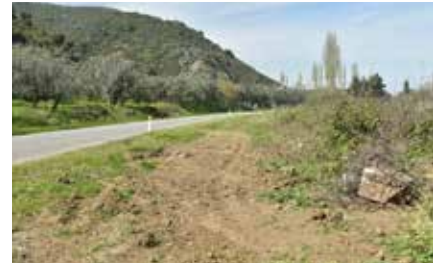
Resim 8: Mermer bloğun ağaç dalları ile kamuflaj edilmesi