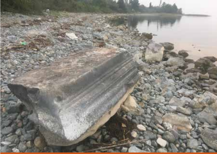
Resim 4: Mermer profilli üst yapı elemanı