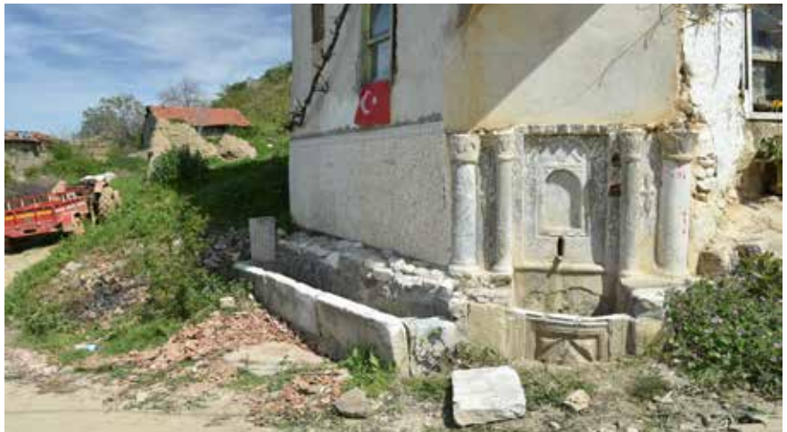
Resim 14: Eski Göllüce/Balarım Mahallesi'nde devşirme malzemeler ile inşa edilen tarihî çeşme