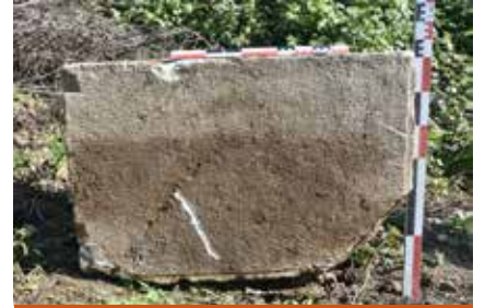
Resim 7: Patak yoldan çıkartılan mermer blok