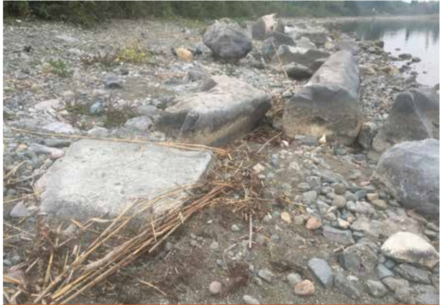
Resim 2: Sular çekildikten sonra