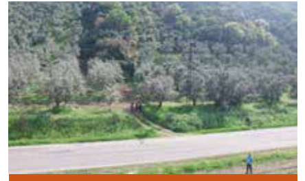
Resim 9: Yapı kalıntısının devam ettiği zeytinlik