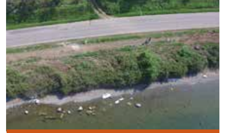
Resim 6: Kıyı ile yol arasında kalan patika yol

Bu buluntu üzerine araştırmalarımızı yolun karşısına kaydırmaya karar verdik (Resim 9). Yolun güneyinde, yol seviyesine göre daha yüksek bir kotta teraslar şeklinde boydan boya uzanan zeytinlik yer almaktadır (GPS: 40.385075, 29.636463). Zeytinliğin içerisinde yaptığımız yüzey taramalarında herhangi bir mimari elemana rastlayamadık. Ancak, yüzeyde gördüğümüz bol miktarda kaba kiremit ve kap-kacak parçaları bizi hiç şaşırtmadı (Resim 10). Alanda gözlemledi-